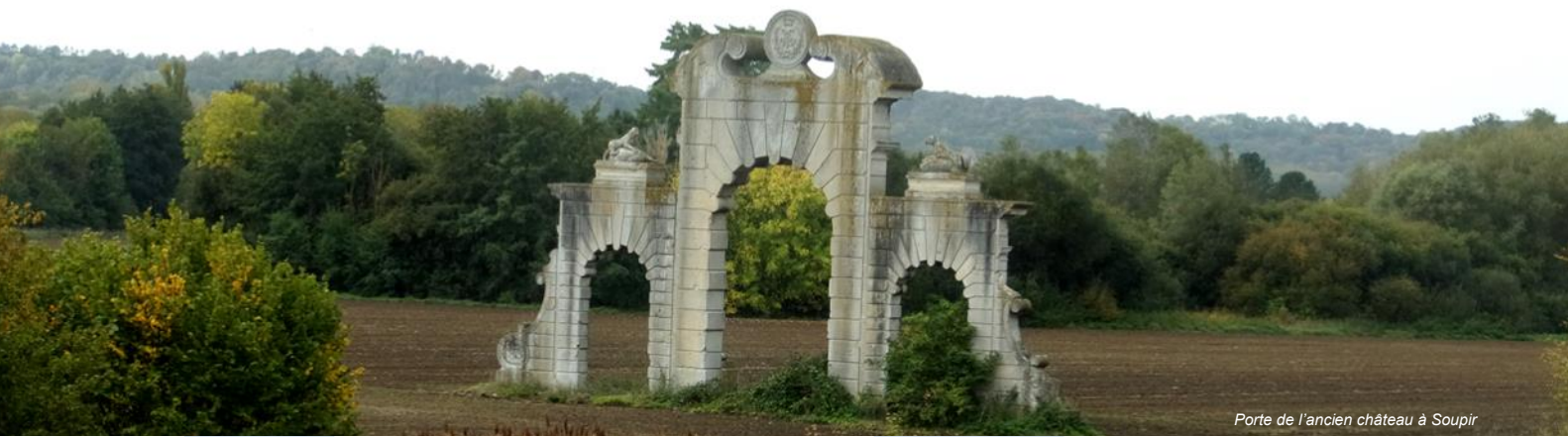
Porte de l'ancien château à Soupir